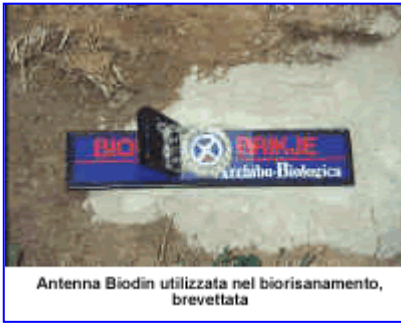
Antenna Biodin utilizzata nel biorisanamento, brevettata