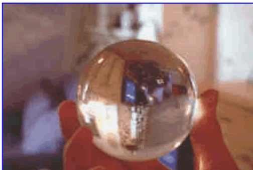
I raggi luminosi creano all'interno della sfera l'immagine olografica della stanza. Lo stesso fenomeno avviene anche all'interno delle stanze e del corpo umano per i campi elettromagnetici esterni

La ricerca è proseguita e nel 1985 Walter Kunnen è riuscito a decodificare le tracce che queste influenze esogene imprimono sul nostro corpo durante le ore di sonno. L'organismo umano è in grado di percepire, registrare e conservare la presenza dei vari campi che continuamente lo attraversano. Come in ogni stanza della casa, in ogni volume del corpo (tronco, collo, testa, arti) si riproduce la stessa immagine tridimensionale, lo stesso ologramma generato dalle influenze esogene del luogo in cui si dorme. Questa straordinaria scoperta consente di affrontare l'argomento con una tecnica molto precisa e completamente innovativa.