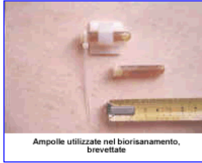
Ampolle utilizzate nel biorisanamento, brevettate

Per contrastare questi effetti nocivi e risanare la Biosfera Walter Kunnen ha messo a punto una tecnica di biorisanamento dei luoghi ma soprattutto dell'abitazione, dove la zona letto è sicuramente la più importante e delicata. Come afferma il ricercatore belga "L'uomo passa la notte nel suo letto".